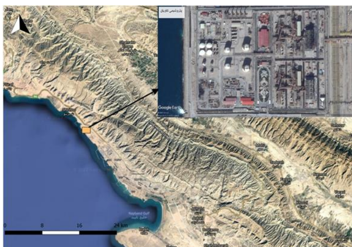
شکل ۱- ناحیه مورد مطالعه و نمایی از الفین یازدهم

پتروشیمی کمتر مورد توجه قرار گرفته است (Memon, 2010; Sakai et al., 2011; Manaf et al., 2009). با توجه به افزایش رو به رشد صنایع پتروشیمی در ایران و وجود مشکلات پسماندهای صنعتی و خطرناک ناشی از آنها، وجود مدیریت اصولی و کارآمد بر روند تولید پسماند صنایع پتروشیمی امری ضروری است. از این رو انجام مطالعات لازم در زمینه اجرایی کردن روش‌های کمینه‌سازی پسماندها با استفاده از رویکرد ۳R در صنایع پتروشیمی به عنوان راه‌حل‌های مدیریتی مناسب و طولانی از فواید بالایی برخوردار است و در صورتی که مدیریت پسماندهای صنایع پتروشیمی به صورت مناسب انجام شود، کشور از منافع قابل توجه اقتصادی و محیط‌زیستی آن برخوردار می‌گردد (ثابت اقلیدی و همکاران، ۱۳۹۲). سلسله مراتب مدیریت پسماند، مقوله پایداری و مدیریت پسماند را به نحو مطلوبی به هم گره می‌زند. لذا هدف از این پژوهش بررسی نحوه کمینه‌سازی پسماندهای پتروشیمی کاویان (الفین یازدهم) واقع در منطقه ویژه اقتصادی پارس با استفاده از رویکرد جامع ۳R است و در نهایت تصویری از وضعیت مدیریت پسماندهای پتروشیمی کاویان به منظور کاهش جریان پسماندهای تولیدی ارائه می‌شود.